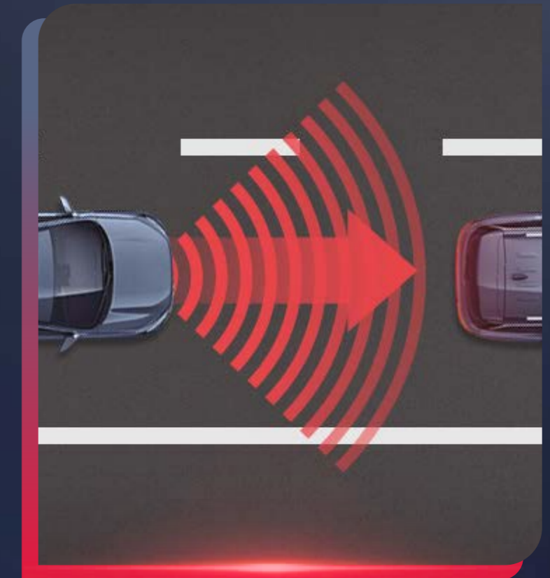
SISTEMA DE FRENADO AUTÓNOMO CON CRUCERO ADAPTATIVO

Pon a prueba la resistencia de esta gran SUV