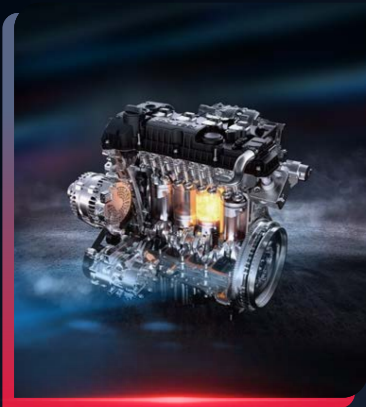
MOTOR 2.0 TURBO

La Jetour X90 PLUS es una SUV completa, gracias a su equipamiento de vanguardia que incluye un motor 2.0 turbo, proporcionando un rendimiento excepcional en todo tipo de rutas.