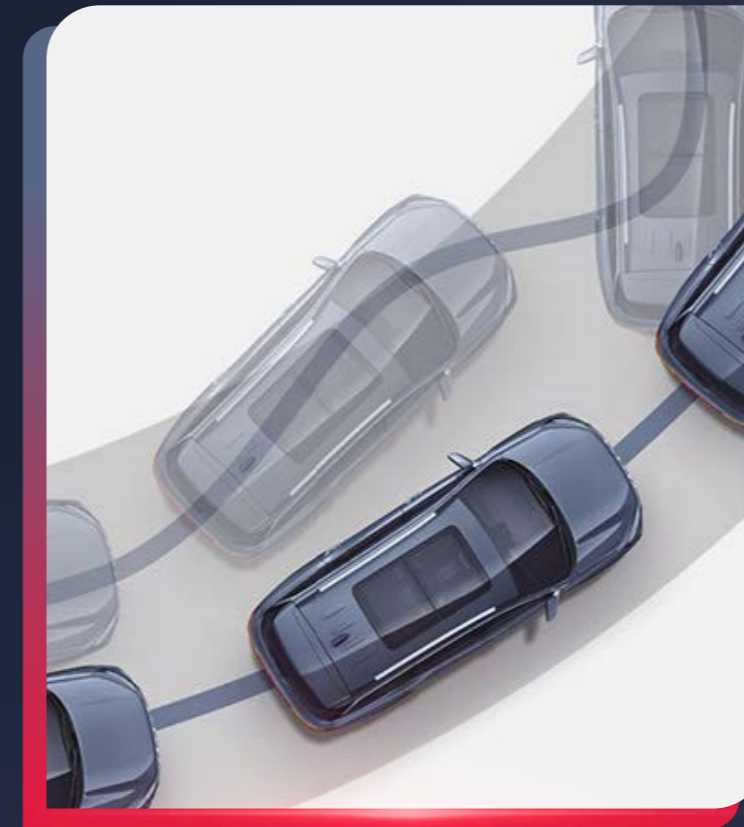
SISTEMA DE CONTROL DE ESTABILIDAD (ESP)